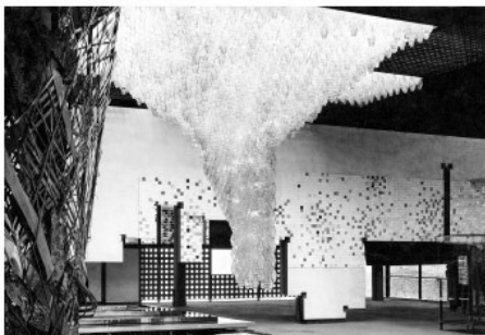
Installazione a poliedri nel padiglione del Veneto, Italia 01, progetto Carlo Scarpa

In mostra sarà presentata così un'accurata selezione di oggetti progettati dai vari designer che collaborarono con la fornace o dall'ufficio tecnico della stessa vetreria illustrando come il tema della luce sia stato affrontato nei vari decenni, in un arco cronologico che va dal 1921 al 1985.