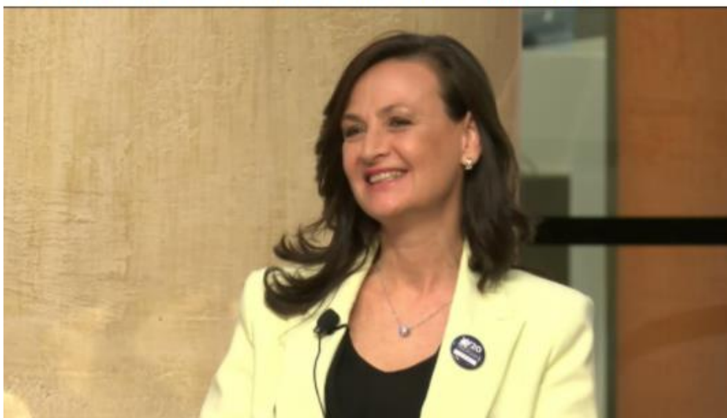
W20 Rome Summit - Panel AIDDA

#AIDDA #women20 #G20 #empowerment #womenempowerment #gendergap #genderequality #donne #imprenditoria #imprenditoriafemminile